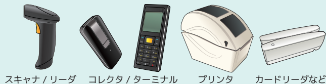
スキャナ/リーダ コレクタ/ターミナル プリンタ カードリーダなど