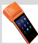
V1s プリンタ搭載 Android スマートターミナル