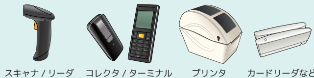
スキャナ / リーダ コレクタ / ターミナル プリンタ カードリーダーなど